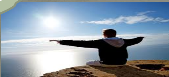
COLÒNIES A LA PLATJA