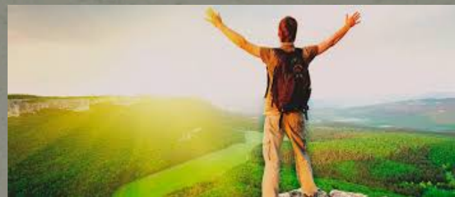
COLÒNIES A LA MUNTANYA